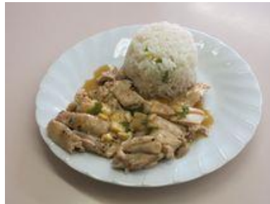
超簡単カオマンガイ