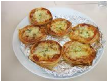
冷蔵庫の残り物でサッとデキる ミニミニ・ピザ