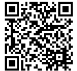
クレオ大阪 講座申込システム (講座名を入力してください)