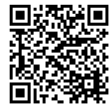
クレオ大阪 講座申込システム (講座名を入力してください)