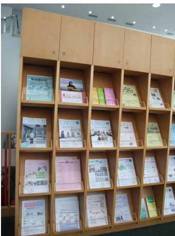
交流サロンのチラシ棚

「ひと（人・一）棚ギャラリー」事業実施要綱・募集要領に基づき、クレオ大阪中央においてグループ等を公募し、実施する。