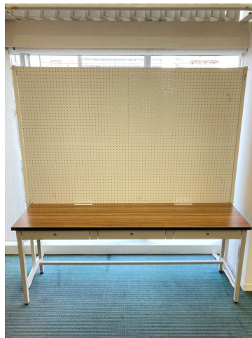
情報・図書コーナーテラス前