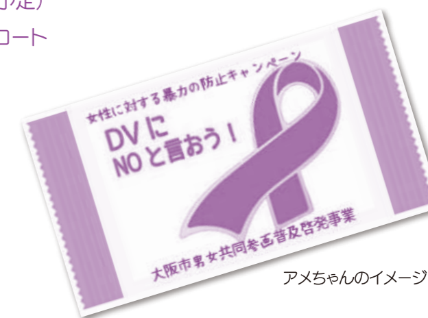
アメちゃんのイメージ

各イベントのお問合せ・申込先 一般財団法人大阪市男女共同参画のまち創生協会(大阪市男女いきいき財団) 電話: 06-7656-9040 ファックス: 06-7656-9045