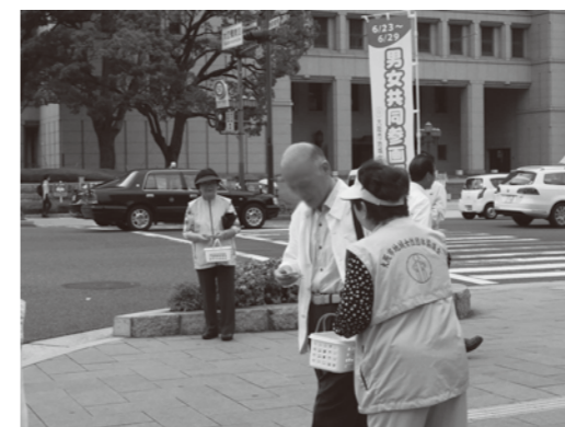
男女共同参画週間街頭啓発キャンペーン(6月)の様子