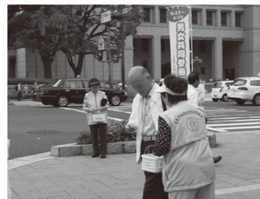
男女共同参画週間街頭啓発キャンペーン(6月)の様子