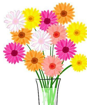
春と秋に咲く花ガーベラ 花言葉は『希望』『常に前進』

国際女性デーは、歴史の作り手であるふつうの女性の物語である。それは男女平等のために、女性たちの社会参加と社会改革を求める幾世紀にもわたる戦いに根差している。——1995年国連文書